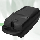
携帯型酸素濃縮装置 AIR WALK AW-1 医療機器承認番号： 21600BZY00373000