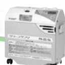
酸素濃縮装置 FH-22/5L 医療機器承認番号： 219ADBZX00080000